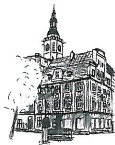
Rynek Wieża ratuszowa